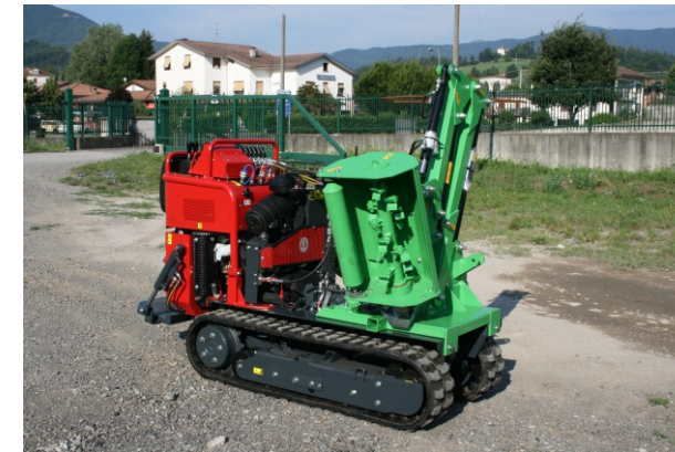
Braccio decespugliatore Bras debroussailleurs