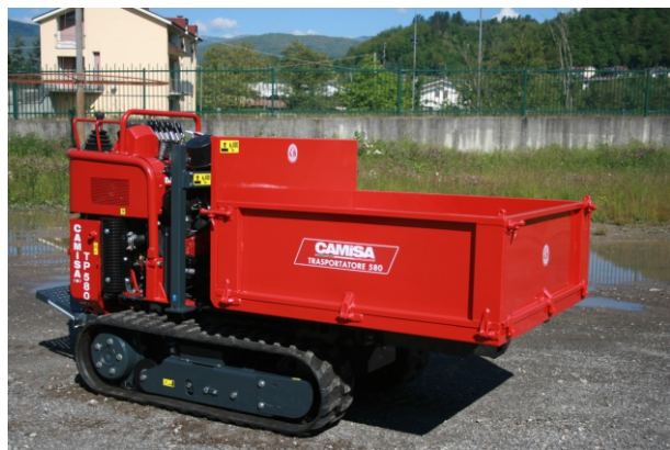
Pianale di carico con ribaltamento idraulico Plateau de chargement avec basculement hydraulique