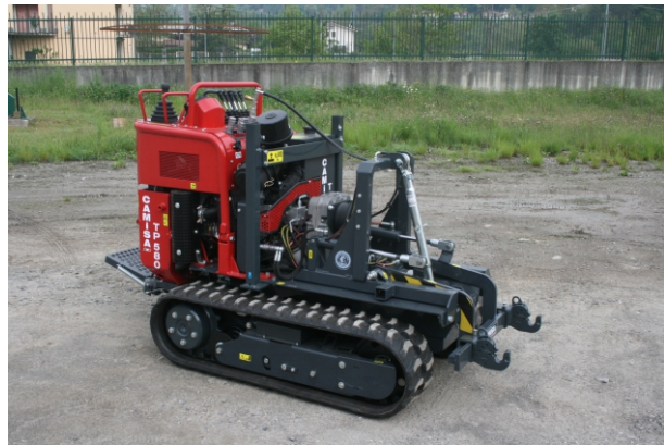
Sollevatore tre punti Relevage trois points