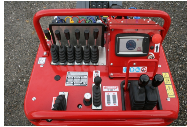
Comando con 2 leve Pilotage avec 2 levier