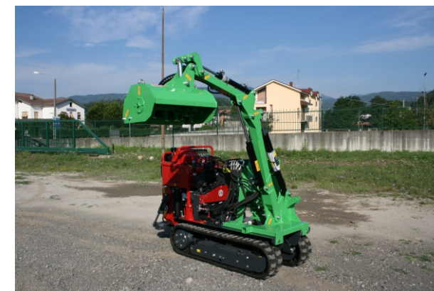
Braccio decespugliatore Bras debroussailleurs