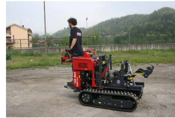
Comando con 2 leve estraibile Pilotage avec 2 levier extractibles