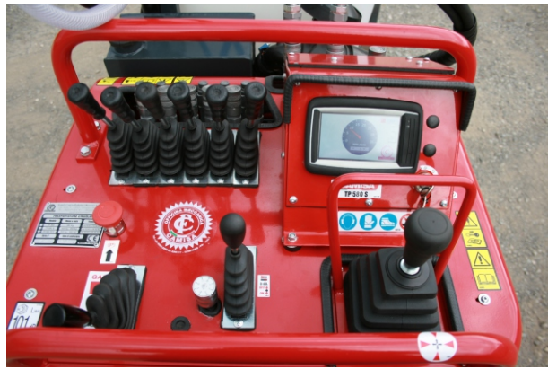
Comando con joystick Pilotage avec joystick