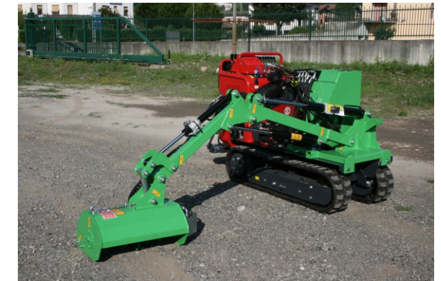
Braccio decespugliatore Bras debroussailleurs