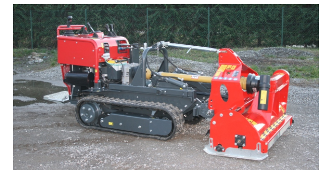
Trinciasermenti frontale Broyeurs frontal