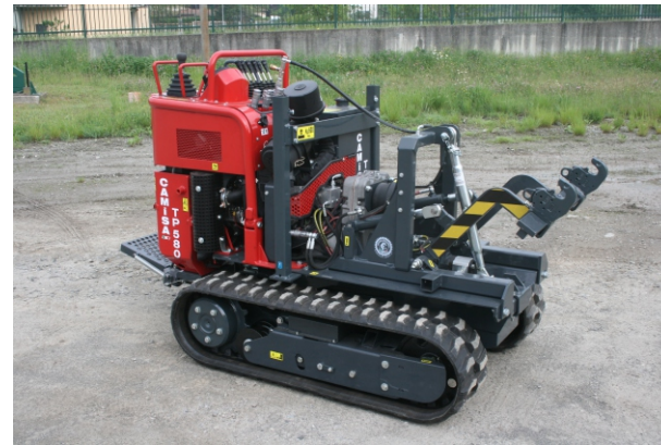
Sollevatore tre punti Relevage trois points