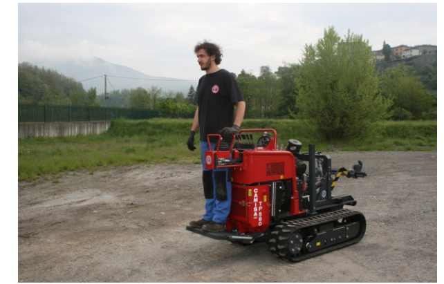
Comando con 2 leve estraibile Pilotage avec 2 levier extractibles