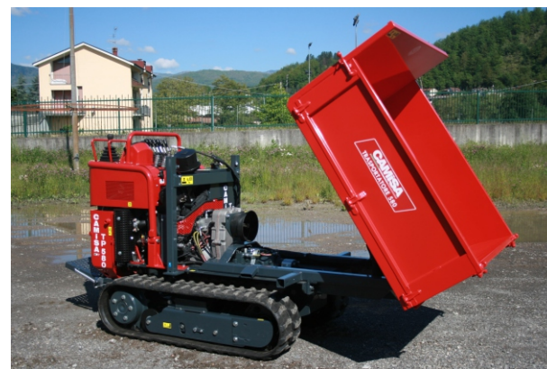
Pianale di carico con ribaltamento idraulico Plateau de chargement avec basculement hydraulique